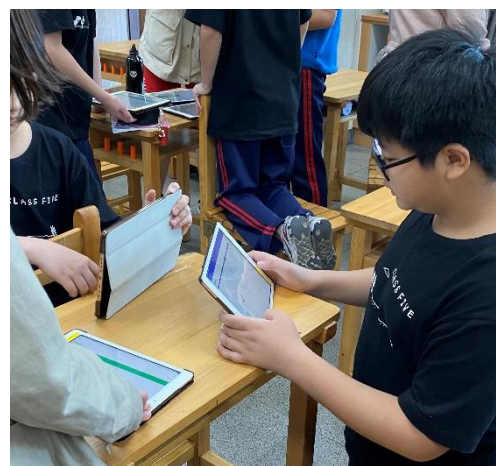
說明：使用 Quizlet 進行小組競賽(2)