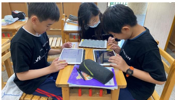
說明：使用 Quizlet 進行小組競賽(1)