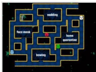
Warm up: level 3 (hard)