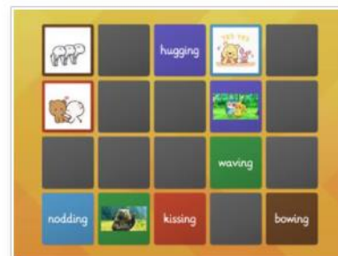
Warm up: level 2 (medium)