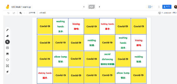
說明：使用 Jamboard 進行桌遊活動(2)