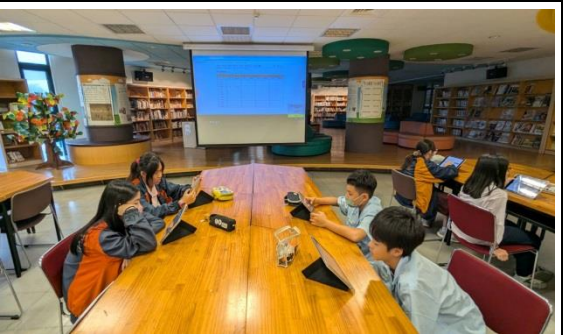
說明：閱讀理解學生閱讀與測驗