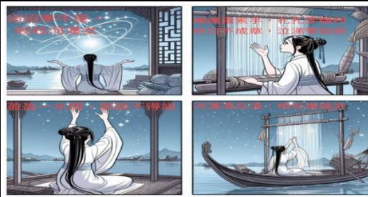
說明：學生創作成果