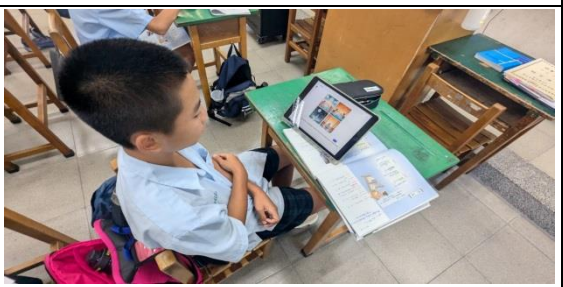
說明：學生在課堂以 Copilot 繪製