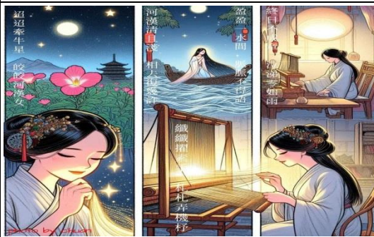
說明：〈迢迢牽牛星〉教師範例