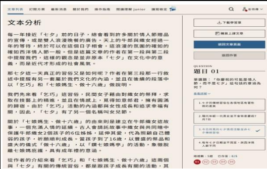
說明：閱讀理解測驗題目