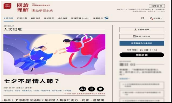
說明：閱讀理解文本