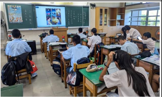
說明：學生在課堂以 Copilot 繪製