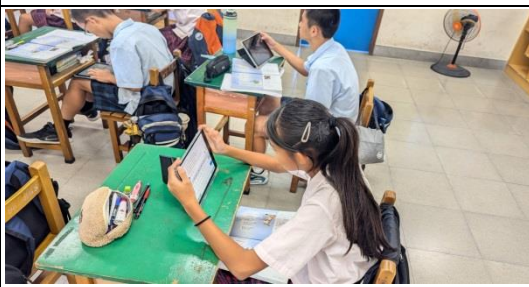
說明：學生在課堂以 Copilot 繪製