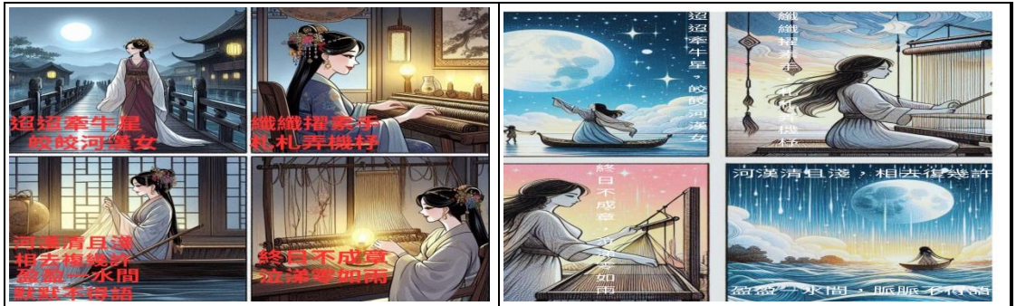
說明:學生創作成果