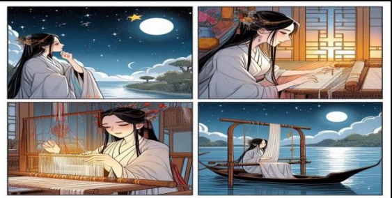
說明：學生創作成果