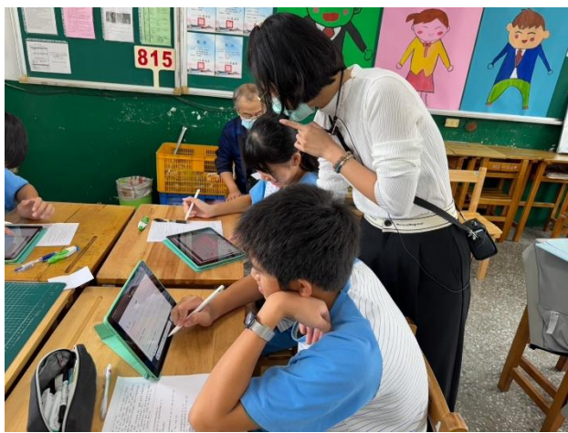
說明：教師到各組進行觀察