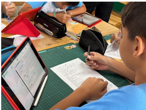
說明：學生閱讀文本內容，完成問題