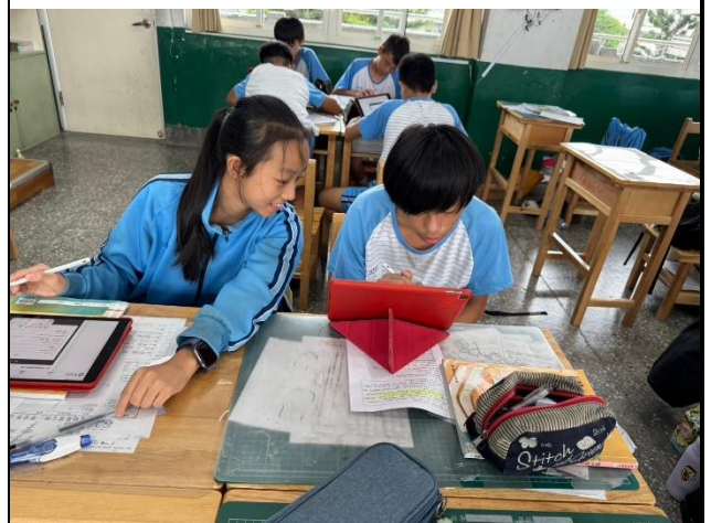
說明：異質分組方式，同儕對話完成問題