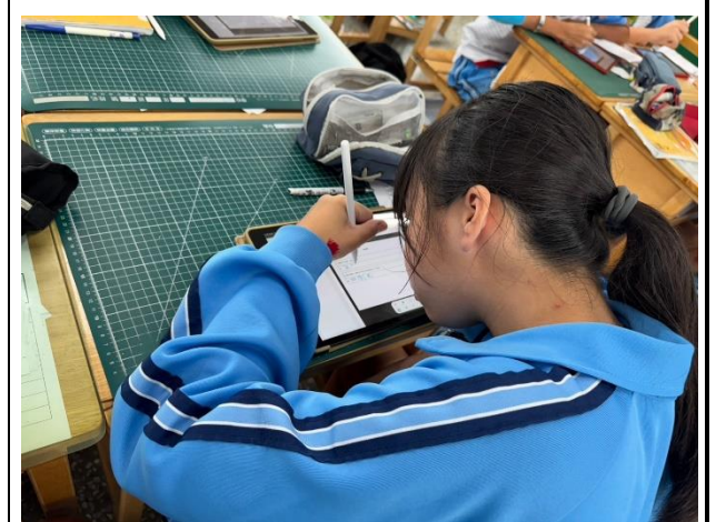
說明：學生透過平板，完成問題