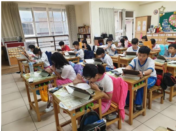
全班一起進行中文語音辨識作業。