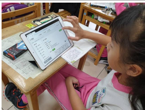
語音錄製功能意外成為最受學生歡迎的功能，搭配耳機後效果變得很好，就算全班一起操作也能達到 80% 以上準確度。