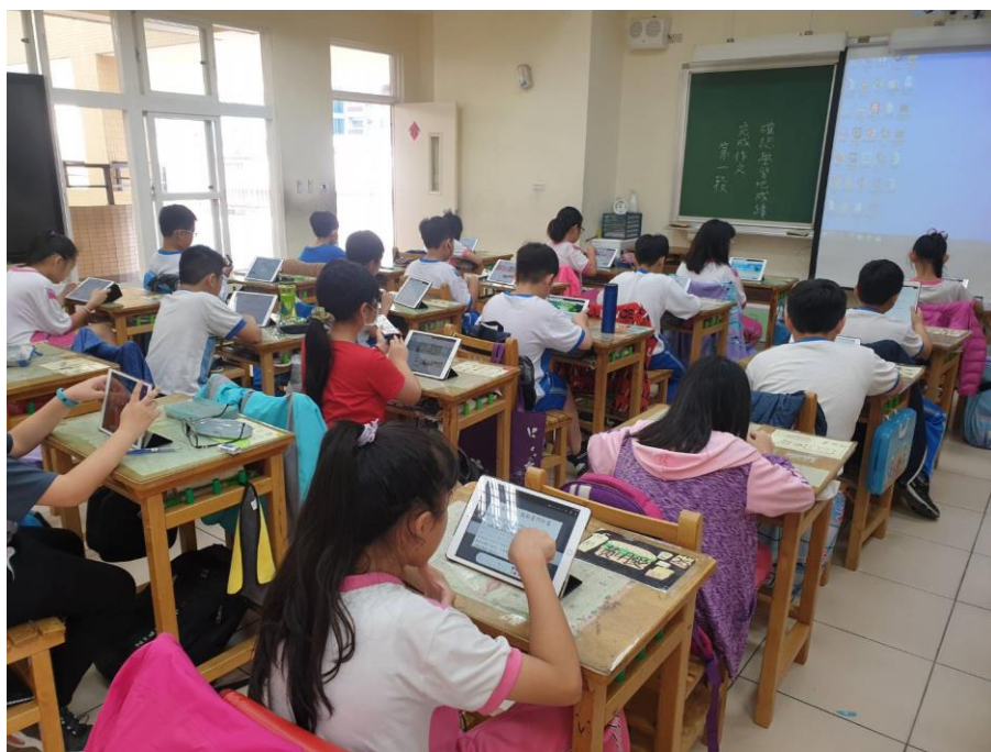
學習吧優勢：1、每個學生依照自己的進度進行各項任務。2、多元評量方式讓學生樂於挑戰。3、克服教室空間視角問題，每位學生都擁有最佳學習位置。