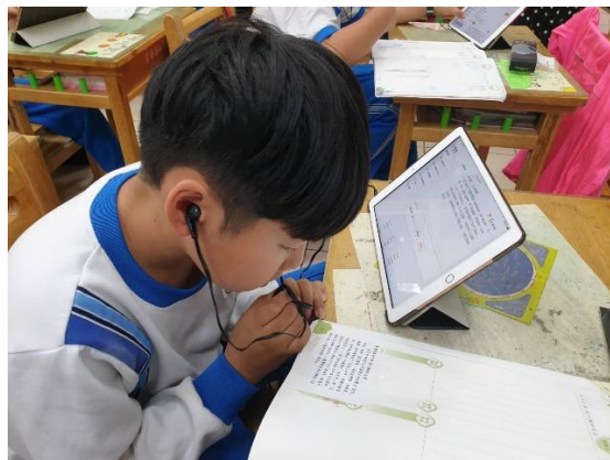
將文章貼在聯絡簿上，學生事先回家準備反覆閱讀，家長也可以協助加強！