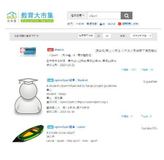
「教育大市集：opencitipart 圖庫」介紹 (簡報製作時使用)