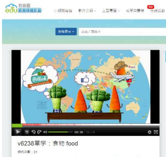
「教育媒體影音：食物」播放及教學