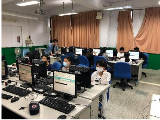
「教育雲」資源介紹及操作示例