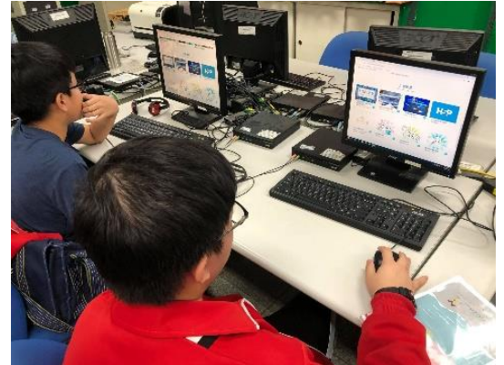
學生自行操作及搜尋練習