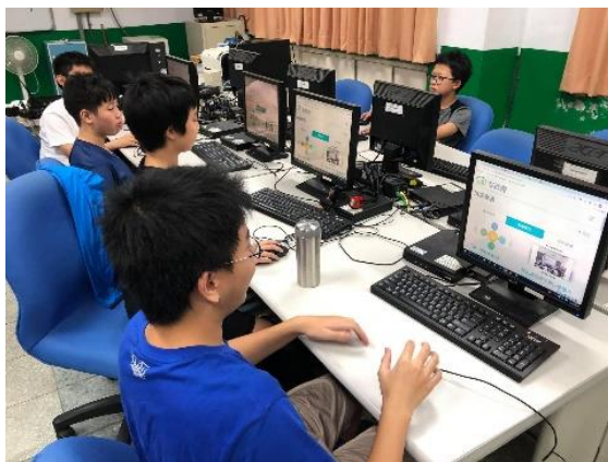
學生利用教育雲平台進行學習