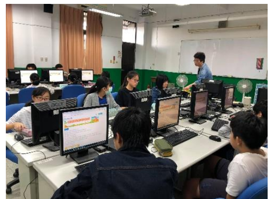
平台資源檢索介紹，簡報任務說明