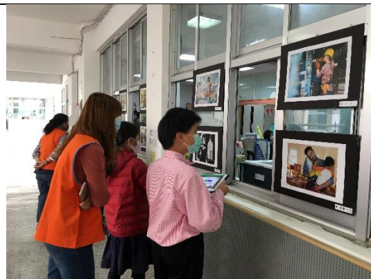
說明：翻轉性別刻板印象的實例