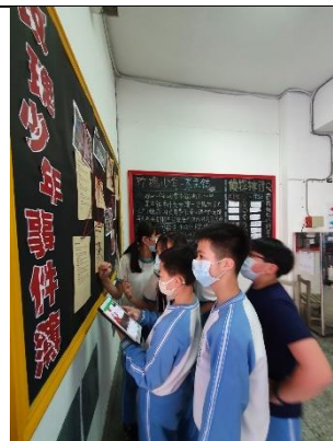
說明：以學習拍素材搭配環境佈置，認識葉永鋇事件。