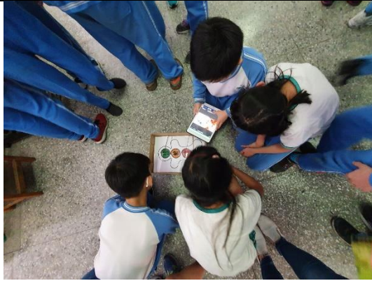
說明：搭配現場道具，進行搜尋線索解謎。