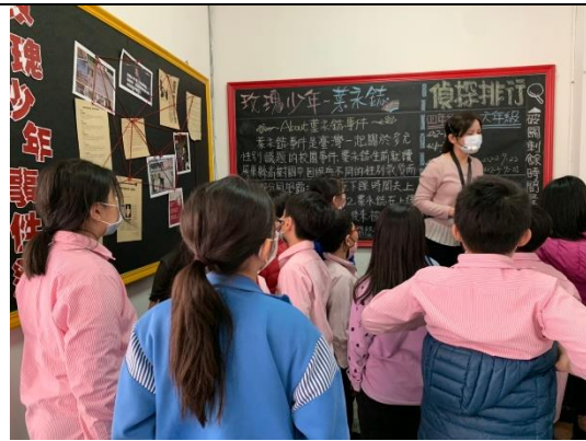
說明：實境解謎後偵探排行登入