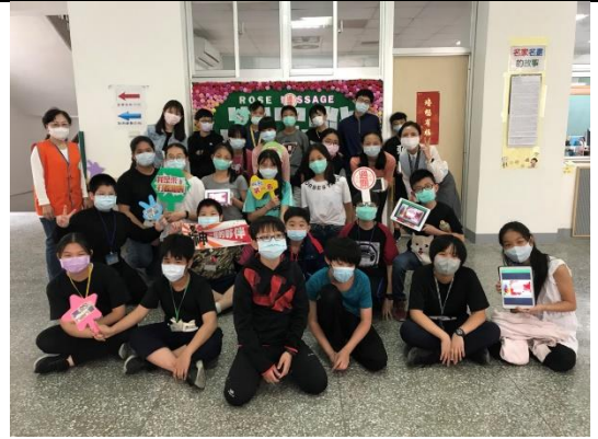
說明：過關學生隊伍拍照留影