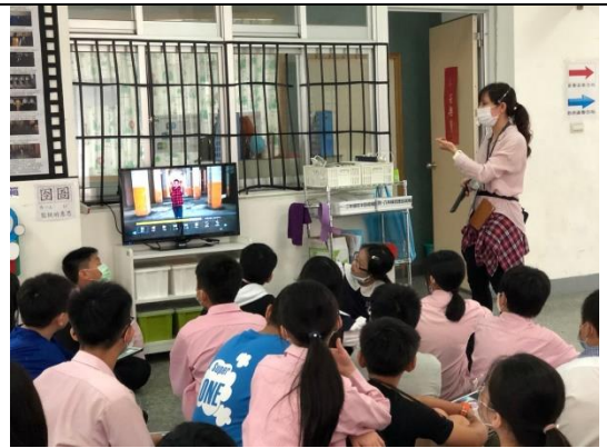
說明：玫瑰少年 MV 欣賞與團討。