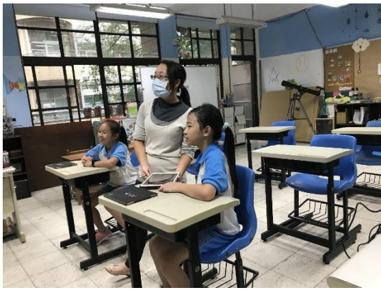
使用「趣決定」，隨機翻出圖卡。