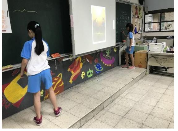
針對圖卡，進行關鍵字聯想。