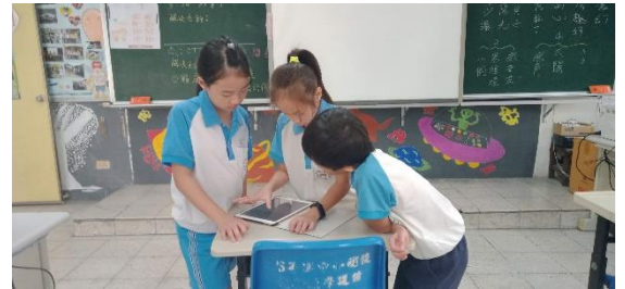
共同修改故事的細節。