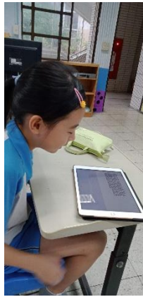
運用語音辨識與備忘錄的功能，記錄故事。