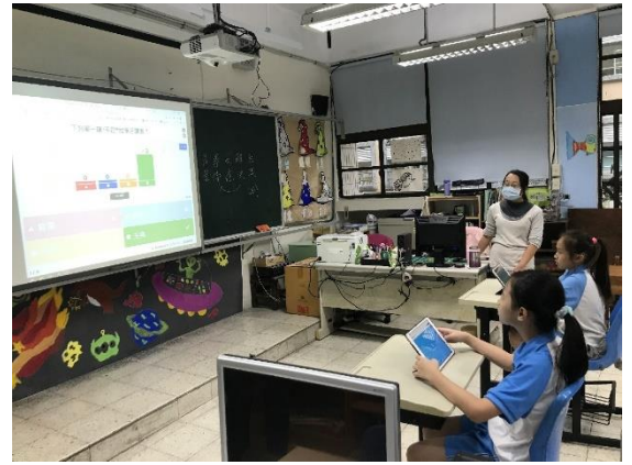
使用 Kahoot，進行要素分析。