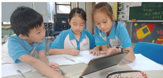
討論要使用的插畫與故事書寫的版面配置。