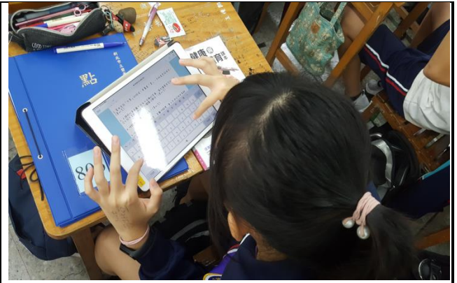
說明: 進入進階第四關知識咖 Holiyo