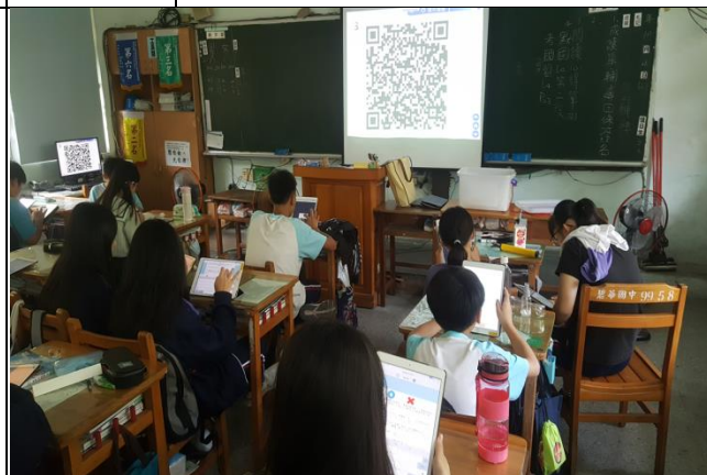
Fig:Holiyo QR code