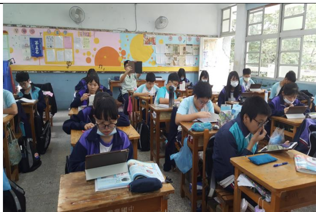
Fig:學生使用 iPad 專注及參與率100%