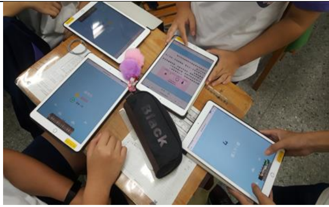
Fig:學生答題並競賽挑戰高分