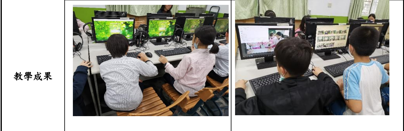
說明：登入親師生平台