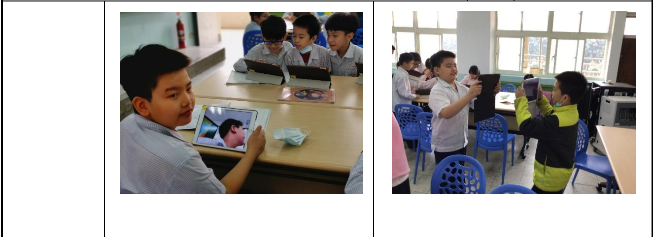
說明：學習用 IPAD 拍照