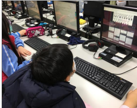
說明：學生完成作業—觀影心得繳交。