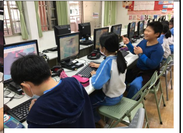
說明：學生線上搜尋豬圈密碼、其他類型密碼示例。