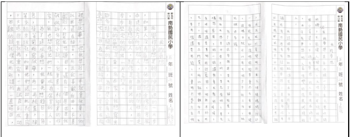
說明:我的夢想—作家