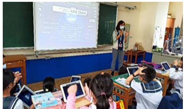
說明：教師導學，根據報表數據回饋學生表現。