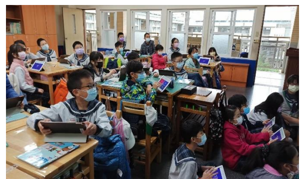
說明：科技輔助教學，讓學生更專注學習，學習不落後。