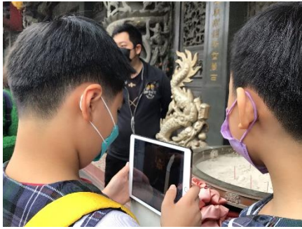
利用平板拍攝、紀錄。