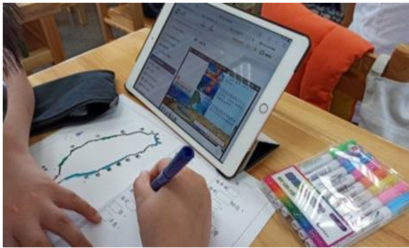
說明：學生自學，根據學習單，使用平板進行課前預習。