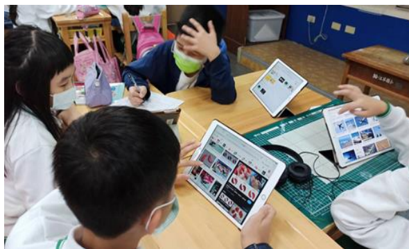
說明：組間互學，利用平板查詢資料、共同討論、釐清迷思。