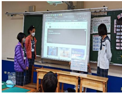
使用資訊媒體展現報告成果。