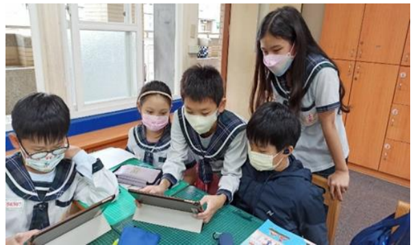
說明：組內共學，開放小組共同討論、對話，增進對課程的理解。