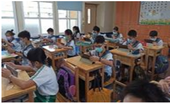
說明：教師提問，學生上網查詢課程的相關資料。