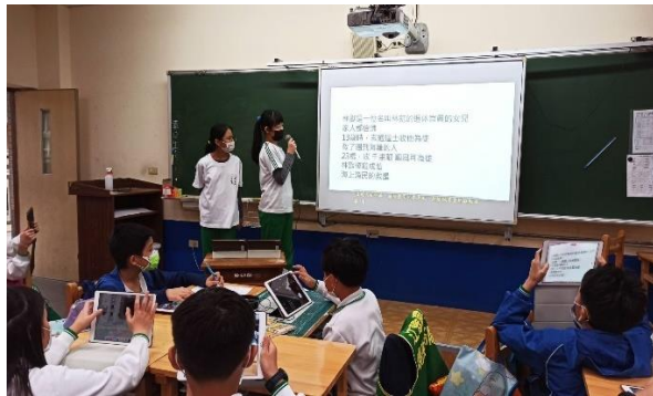
說明：組間互學，利用平板將資料彙整，並上台報告。