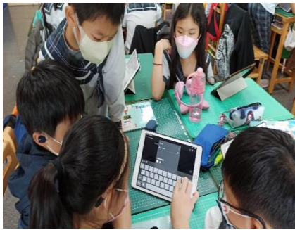
即時查詢，增進學習內容。