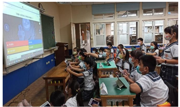
說明：運用 kahoot 出題，調整题目的難易度，讓學生自我檢測。