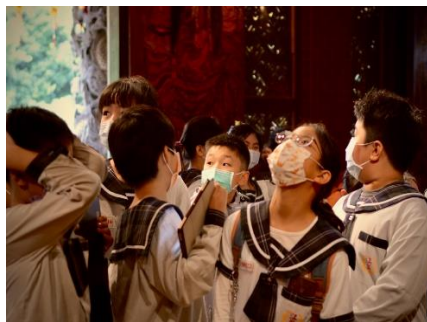
學生透過平板即時記錄導覽內容與同儕表現。