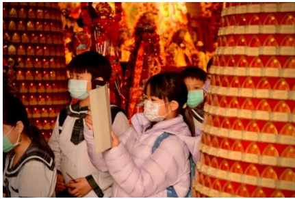
利用平板即時紀錄活動過程。