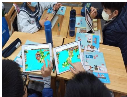
善用 PaGamO，提昇學習興趣。 善用 PaGamO，同儕相互研究。