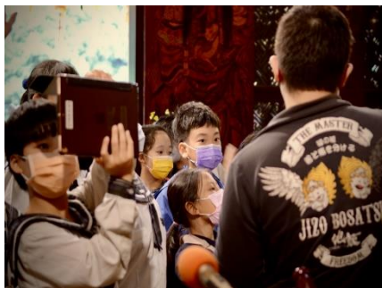
拍攝導覽員介紹江子翠歷史，內容豐富生動。