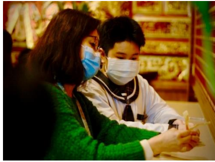
紀錄師生折符紙的精彩畫面。