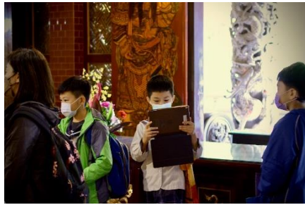
利用平板尋找解答。