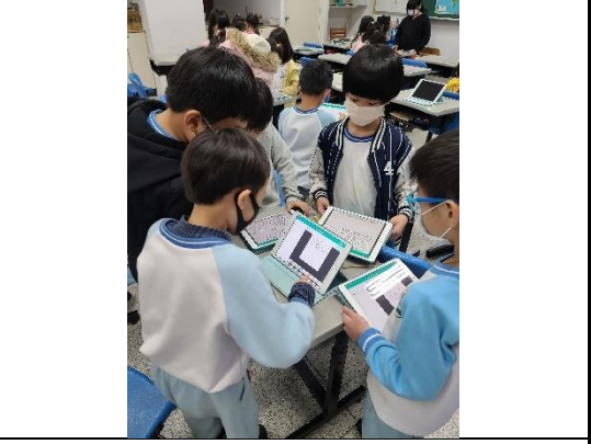
說明：學生撰寫【1】社團報名簡章與自我評估統整表。