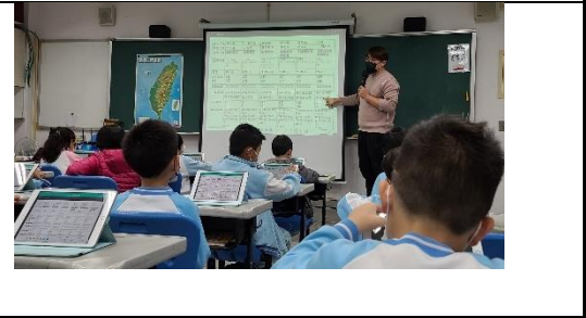
說明：【7】小試身手，全班各題答對率分析。