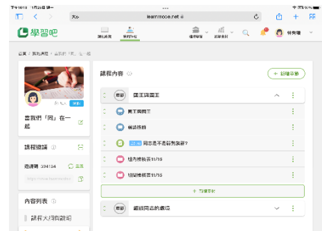
說明：課程脈絡呈列1