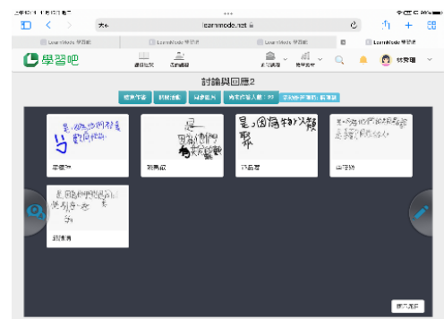
說明：各組回應狀況(擇策、調節)