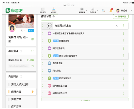
說明：課程脈絡呈列2