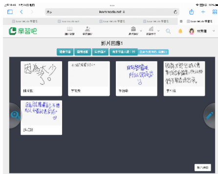
說明：各組回應狀況(擇策、調節)