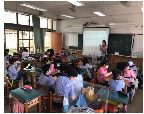
說明：學生分組討論實況(擇策、調節)