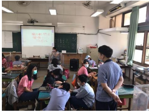
說明：學生報告實況(擇策)