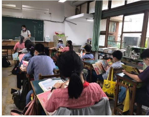
說明：學生閱讀繪本狀況