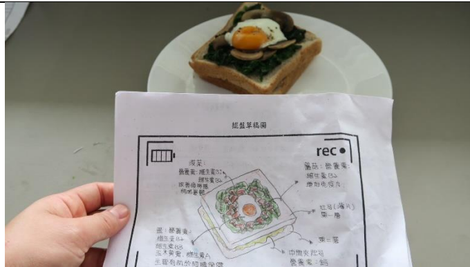
利用電腦平板查詢护眼營養素