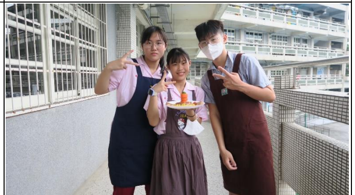
小組作品成果合影