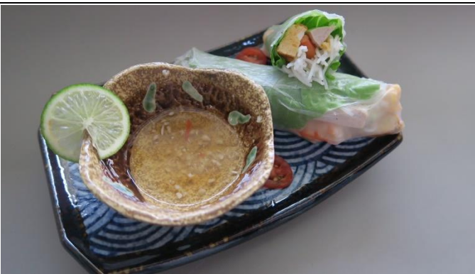
學生實作作品-越式春捲