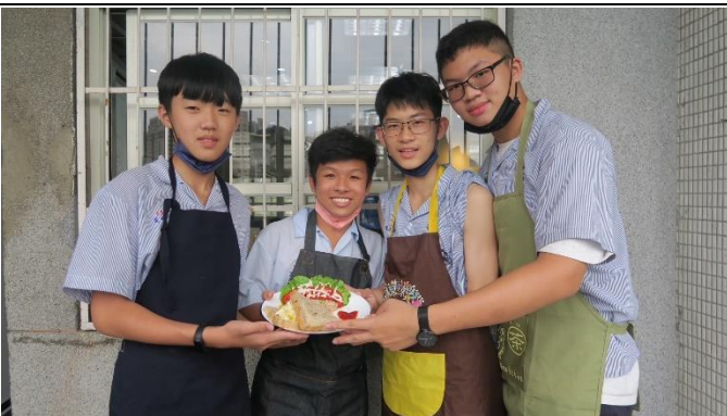
小組作品成果合影