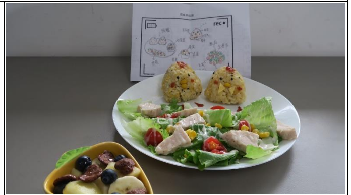
將平面食譜膳食設計具現出來