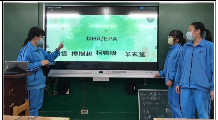
利用平板載具與 Canva 軟體彙整製作成 PPT