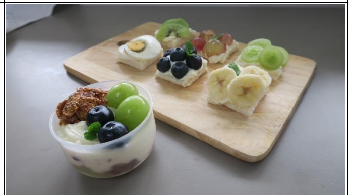
學生實作作品-優格青花三明治