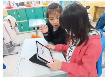
說明：組內共學-討論心智圖。