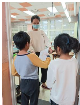
說明：執行解決方案-詢問導師能否張貼在各班教室。