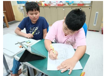
說明：海報設計-校園危險角落地圖。