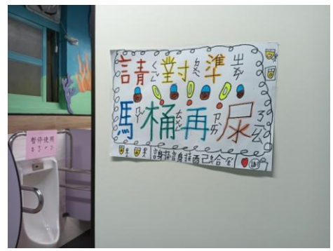
說明：執行解決方案-在廁所張貼公告海報。