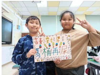
說明：海報設計-請對準馬桶再尿。