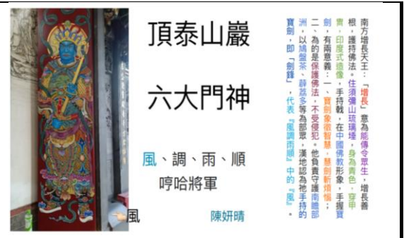
學生介紹六大門神他手上拿的物品