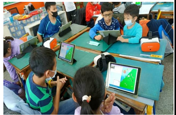
NEARPOD 遊戲式爬山競賽驗收學習成果