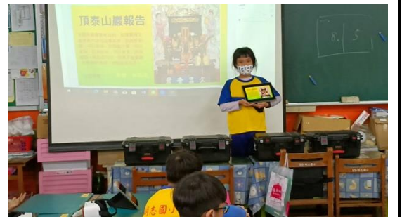
每組推派同學上台做組間分享