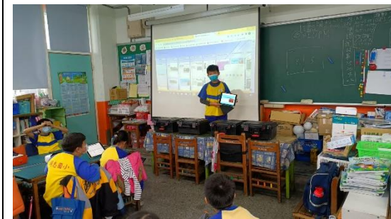
每組推派同學上台做組間分享