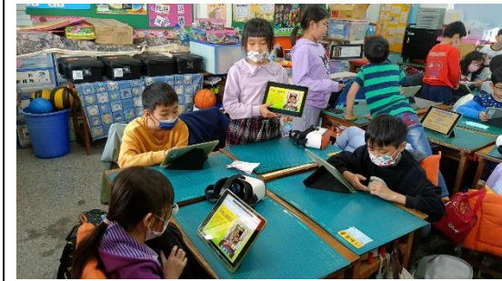
學生分組做頂泰山巖資料 PPT，並於組內分享解說。