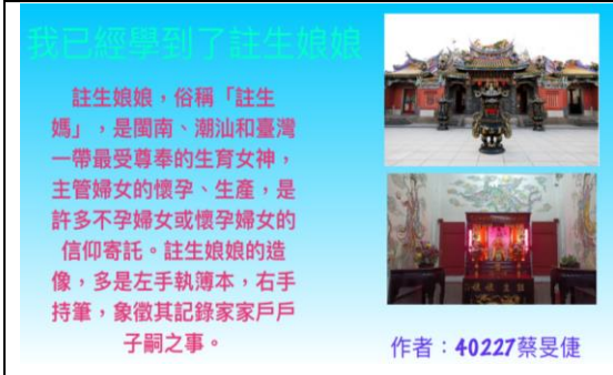
學生用 KEYNOTE 介紹廟內神明