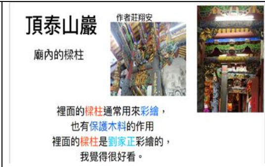
學生介紹廟內樑柱彩繪目的及作者