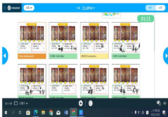
NEARPOD 互動式學習單(六大門神填填看)