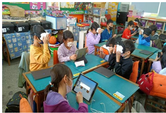
兩兩一組輪流用 VR 與平板體驗