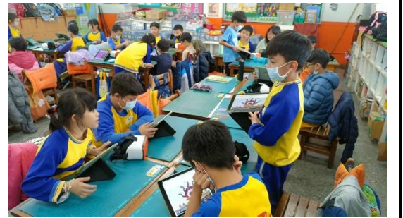
學生分組做頂泰山巖資料 PPT，並於組內分享解說。