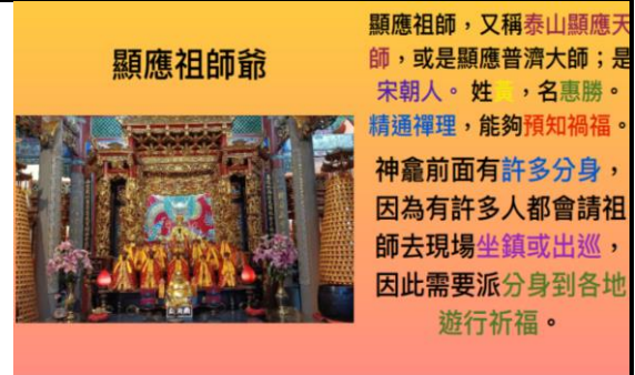
學生用 KEYNOTE 介紹顯應祖師及分身