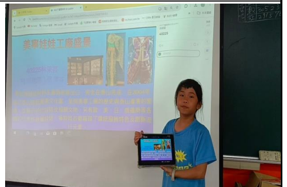
組內分享後，選派一名作組間分享。