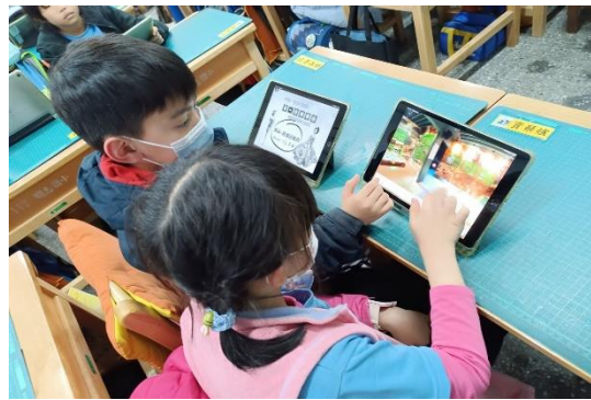
學生自學觀看之前學長姐做的「美寧娃娃館」COSPACES 資料