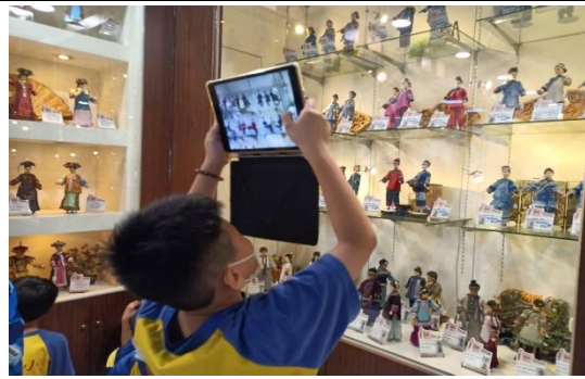
美寧娃娃參訪 1130514(學生拍照)