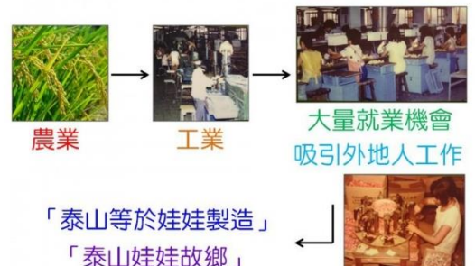
美寧工廠對泰山的影響