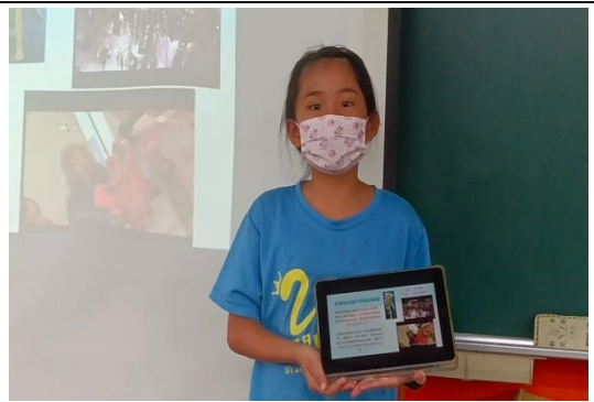
組內分享後，選派一名作組間分享。