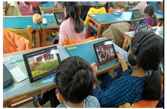
學生自學觀看閱讀 Youtube 裡有關「芭比娃娃」及「美寧娃娃館」的影片(放置<學習吧!>)