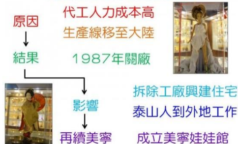
美寧工廠沒落的原因及影響