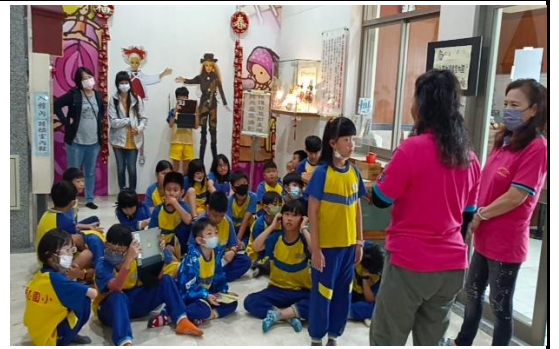
美寧娃娃參訪 1130514(學生訪問中)