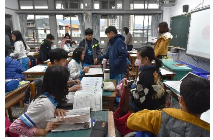
第十課 少年筆耕 師範範

1. 這是為少年十二歲，他的爸爸是一名鐵路員，二樓家中人口多，生活維艱，他為了節省開支，他決定在學校後方的鐵道旁，每天步行回家可賺五塊，但爸爸卻說「爸爸，我學業不精，爸爸別給我錢，爸爸別給我錢。」 2. 爸爸說：「爸爸，我學業不精，爸爸別給我錢，爸爸別給我錢。」 3. 爸爸說：「爸爸，我學業不精，爸爸別給我錢，爸爸別給我錢。」 4. 爸爸說：「爸爸，我學業不精，爸爸別給我錢，爸爸別給我錢。」 5. 爸爸說：「爸爸，我學業不精，爸爸別給我錢，爸爸別給我錢。」 6. 爸爸說：「爸爸，我學業不精，爸爸別給我錢，爸爸別給我錢。」 7. 爸爸說：「爸爸，我學業不精，爸爸別給我錢，爸爸別給我錢。」 8. 爸爸說：「爸爸，我學業不精，爸爸別給我錢，爸爸別給我錢。」 9. 爸爸說：「爸爸，我學業不精，爸爸別給我錢，爸爸別給我錢。」 10. 爸爸說：「爸爸，我學業不精，爸爸別給我錢，爸爸別給我錢。」 11. 爸爸說：「爸爸，我學業不精，爸爸別給我錢，爸爸別給我錢。」 12. 爸爸說：「爸爸，我學業不精，爸爸別給我錢，爸爸別給我錢。」 13. 爸爸說：「爸爸，我學業不精，爸爸別給我錢，爸爸別給我錢。」 14. 爸爸說：「爸爸，我學業不精，爸爸別給我錢，爸爸別給我錢。」 15. 爸爸說：「爸爸，我學業不精，爸爸別給我錢，爸爸別給我錢。」 16. 爸爸說：「爸爸，我學業不精，爸爸別給我錢，爸爸別給我錢。」 17. 爸爸說：「爸爸，我學業不精，爸爸別給我錢，爸爸別給我錢。」