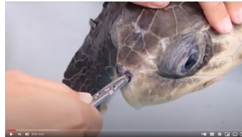
【中文字幕】台灣動物保育協會與動物地球不棄為我們轉譯片(邱佩蓉 字幕)