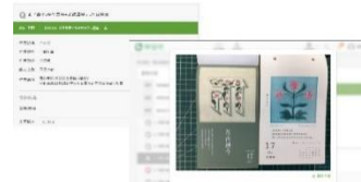
台灣百年老花磚 - 花磚圖案畫裝介紹

花磚的正式名稱是「馬約利卡磚」(Majolica Tile),屬於陶器,其表面有彩繪的圖案,是古早人類的象徵。臺灣傳統民間工藝中,花磚是極具特色的。所以,我們常會看到一些古早的建築,比如古早的廟宇,或是古早的民宅,都會看到花磚的裝飾。及聞其獨有的香氣。